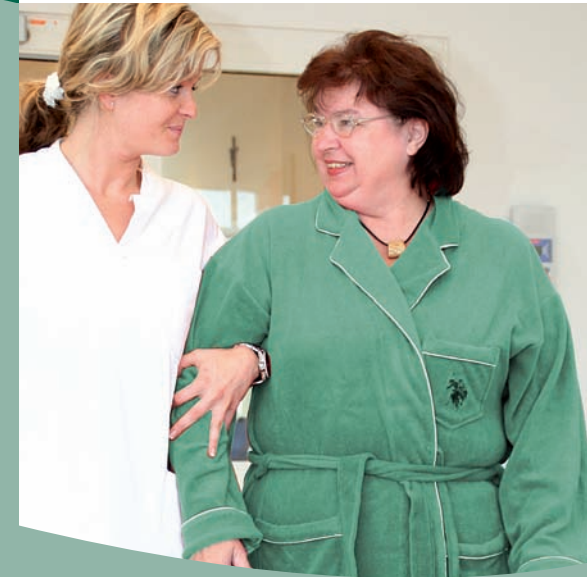
Geriatric in Wilhelmsburg

Förderverein Rehabilitationszentrum in Hamburg – Wilhelmsburg e. V.